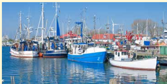
Mindestteilnehmer für diese Reisen 20 Personen bis 6 Wochen vor Reiseantritt.

Zum letzten Mal stärken wir uns am leckeren Frühstücksbuffet, dann müssen wir leider schon „Tschüß“ sagen. Über den „größten Kleiderbügel der Welt“, die 963 m lange Fehmarnsundbrücke, treten wir die Heimreise an. In Hamburg, an den Landungsbrücken legen wir noch einmal einen Halt für die Mittagspause ein, bevor es endgültig nach Hause geht.