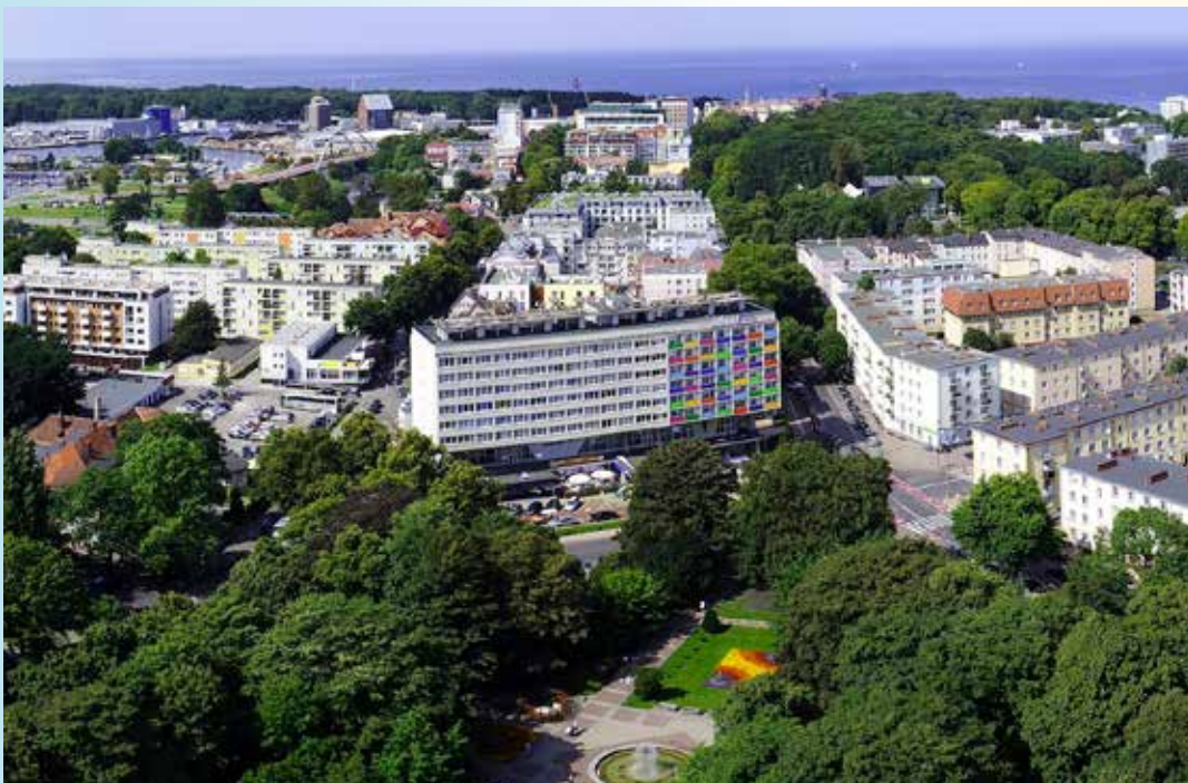
Mindestteilnehmer für diese Reisen 20 Personen bis 6 Wochen vor Reiseantritt.